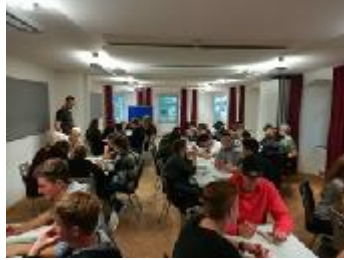
Kennenlernfreizeit auf der Sonnenmatte (WG 11 und TG 11)