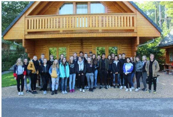
Kennenlertage im Donautal (BK1c)