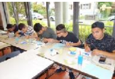
Kompetenzanalyse (VAB-Klassen, 2BFM1)