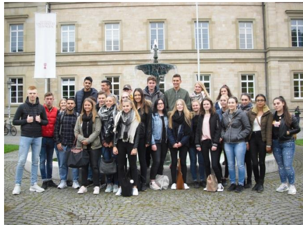
Besuch der Universität Tübingen (BK2b)